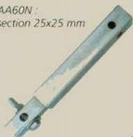
AA60N : section 25x25 mm