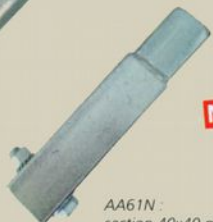
AA61N : section 40x40 mm